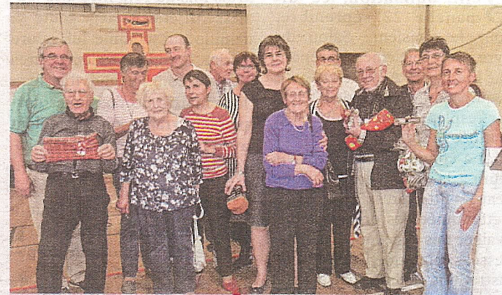
Les équipages gagnants du rallye des clochers.

Plus de cent personnes rassemblées dans trente véhicules ont participé au rallye des clochers concocté par la paroisse Saint-Brice. Une belle opportunité pour découvrir les onze édifices religieux qui se trouvent sur le secteur de la vallée de l'Indre et répondre aux questions posées. Compte tenu de cette forte fréquentation, deux départs étaient prévus, l'un à Artannes, l'autre à